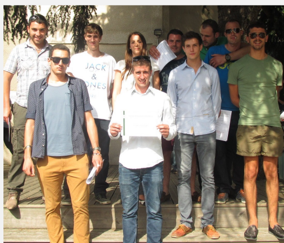
Promotion 34 CONDUCTEURS DE TRAVAUX TP