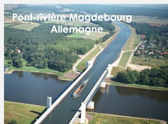
Pont-rivière Magdebourg Allemagne